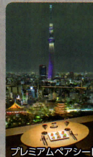
プレミアムペアシート (イメージ)

お時間をお選びいただけます。[1部]17:30~19:30 [2部]19:45~21:45