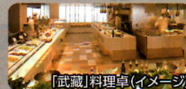
「武蔵」料理卓(イメージ)

26階「スカイグリル ブッフェ&バー 武蔵」 プレミアムペアシートまたは テーブル席 ディナー付きプラン