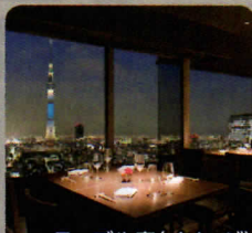
テーブル席(イメージ)