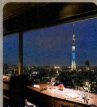
カップルシート(イメージ)

産地にこだわった 食材を用い、旬の 素材と心を込めた 「和食料理」でのお もてなしをご堪能 くださいませ。