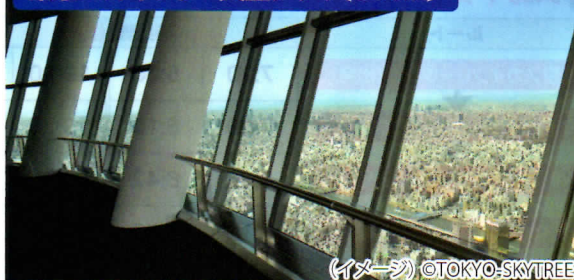
(イメージ)