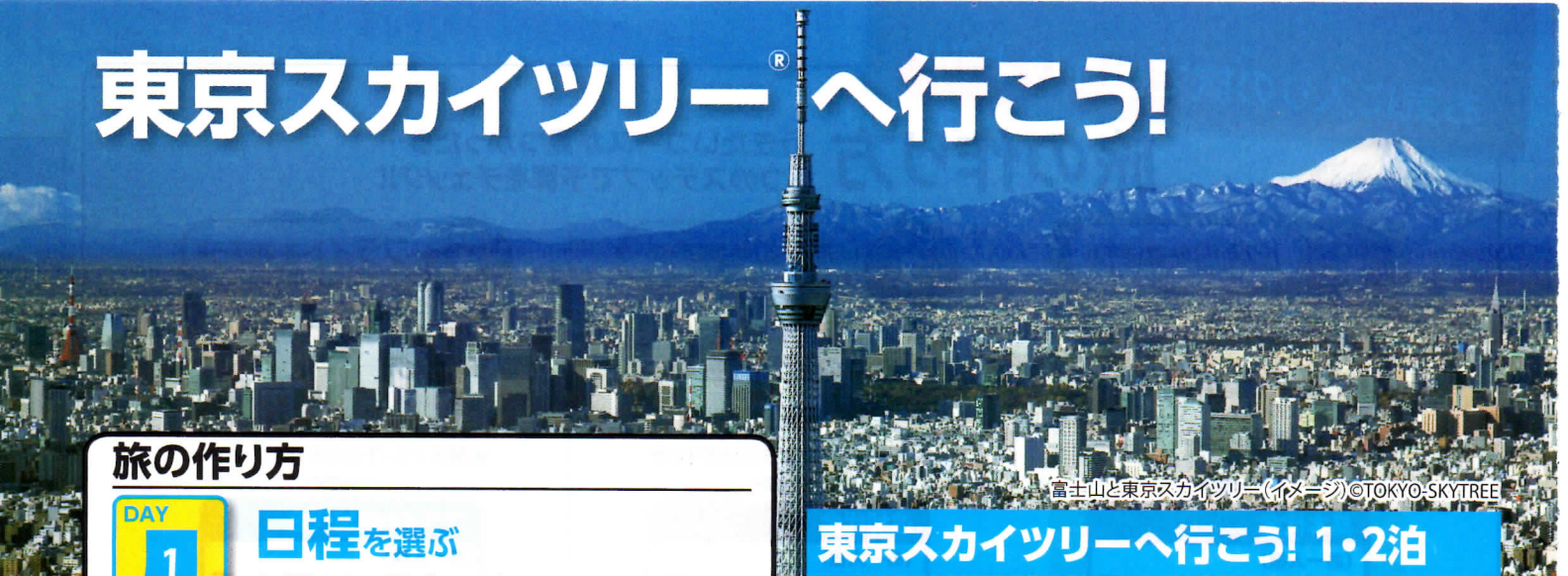
富士山と東京スカイツリー(イメージ)