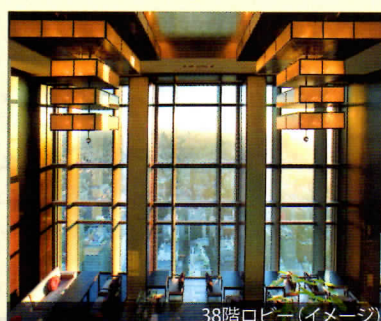
38階ロビー(イメージ)