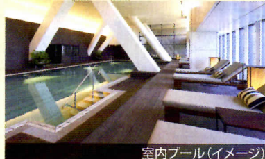
室内プール(イメージ)