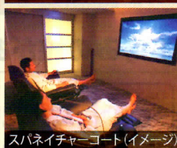
スパネイチャーコート (イメージ)