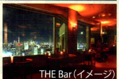
THE Bar (イメージ)