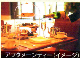
アフタヌーンティー(イメージ)