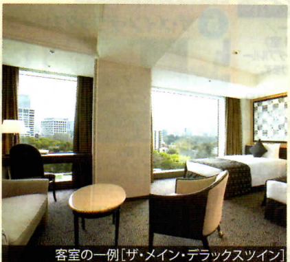
客室の一例 [ザ・メイン・デラックスツイン]