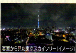
客室から見た東京スカイツリー (イメージ)