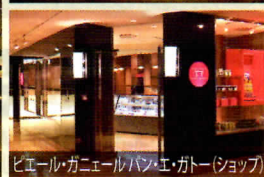
ピエール・ガニエール パン・エ・ガトー (ショップ)