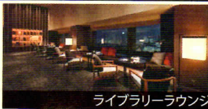
ライブラリーラウンジ