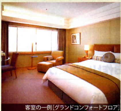
客室の一例 [グランドコンフォートフロア]

日本の伝統美を受け継ぐ静謐なたたずまいと上質なくつろぎの空間。 世界の賓客をもてなす「真のホスピタリティ」をご提供します。