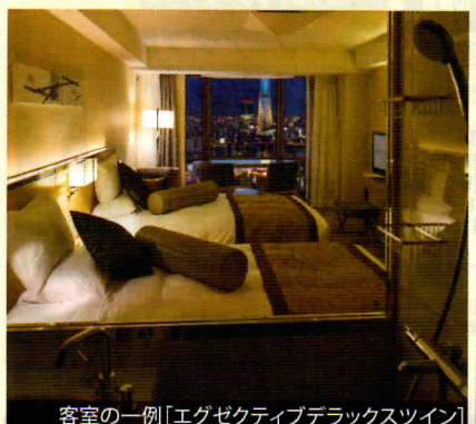
客室の一例 [エグゼクティブデラックスツイン]