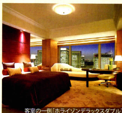
客室の一例【ホライゾンデラックスダブル】

シャングリ・ラホテル 東京は東京駅隣接という抜群なロケーションにありながら、「桃源郷」を再現したかのような安らぎと華やかさが融合した最高級の施設と、温かいアジアホスピタリティでお客様をお迎えしています。