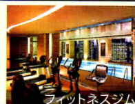
フィットネスジム