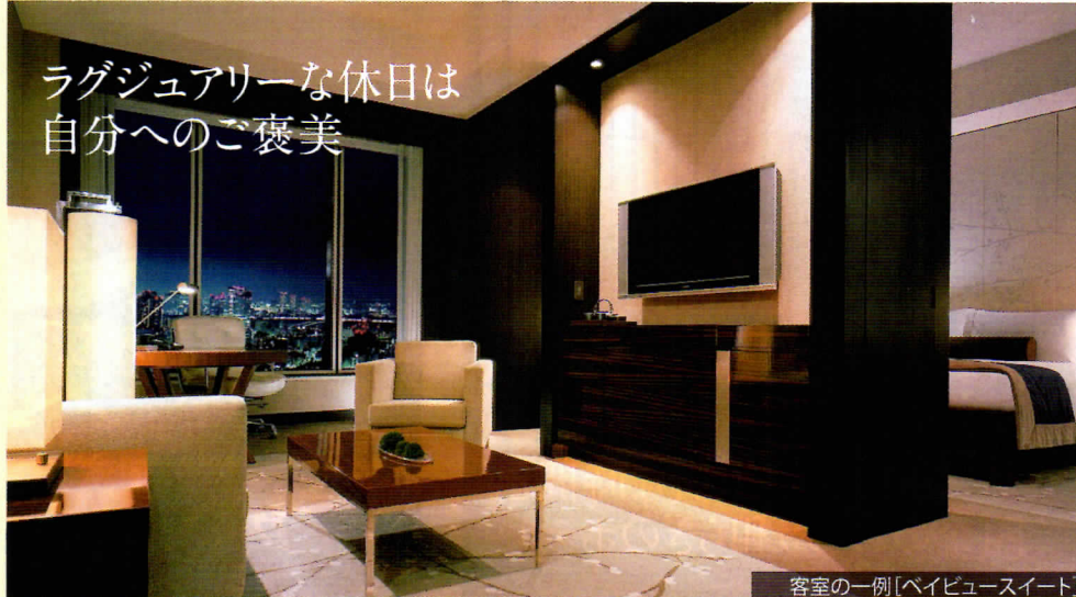
客室の一例 [ベイビュースイート]