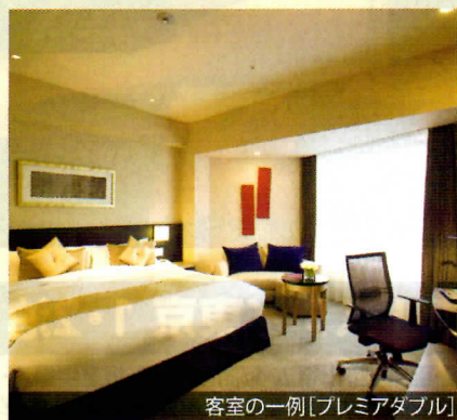
客室の一例 [プレミアダブル]