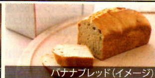
パナナブレッド(イメージ)