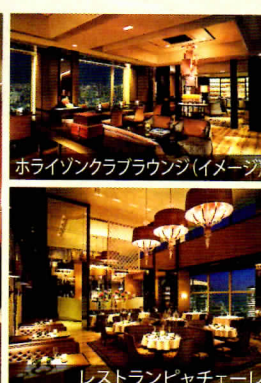
ホライゾンクラブラウンジ(イメージ)