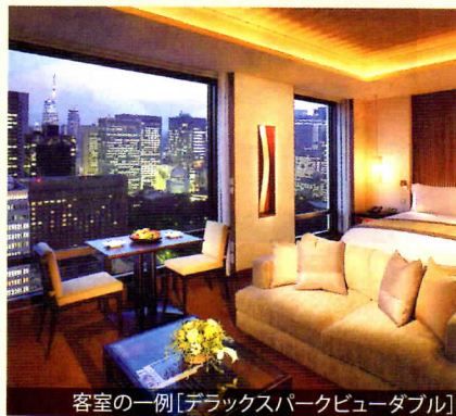
客室の一例【デラックスパークビューダブル】

「東洋の貴婦人」と呼ばれるザ・ペニンシュラ香港を旗艦店に持ち、 2007年、東京・日比谷に開業。 「ペニンシュラ・ホスピタリティ」と称される家族的なサービスが特徴。