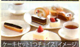
ケーキセット1つチョイス (イメージ)