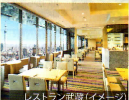
レストラン武蔵 (イメージ)