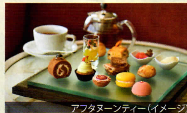
アフタヌーンティー(イメージ)