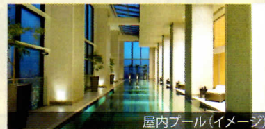
屋内プール(イメージ)