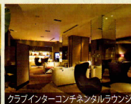
クラブインターコンチネンタルラウンジ