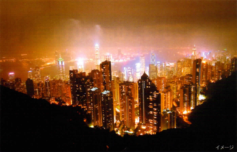
香港 超高層ビルの摩天楼、電飾看板、スノップなレストラン、高級ホテル、昔ながらの粥屋…。大都会の顔とアジアの胡散臭さと両方あわせ持つ香港ってやっぱり面白い。