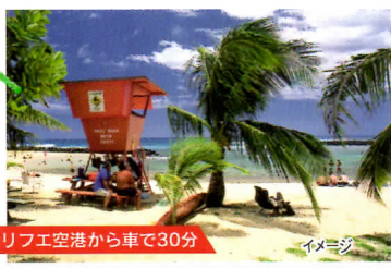
リフエ空港から車で30分 イメージ

ワイルア川流域は、ポリネシア大航海時代によってきた人々が安住の地とした場所として知られ、今でもヘイアウと呼ばれる神殿等の遺跡が残っています。ボートツアーで川を遡った先に現れるのは「シダの洞窟」。その昔、王族が結婚式を挙げた神聖な場所です。