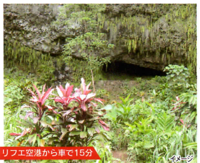
リフエ空港から車で15分 イメージ

北部ののどかな町「ハナレイ」。メイドインカウアイのギャラリーやショップが集まるこの町は、地元の人にも大人気エリア。何度も訪れたくなる独特な雰囲気です。