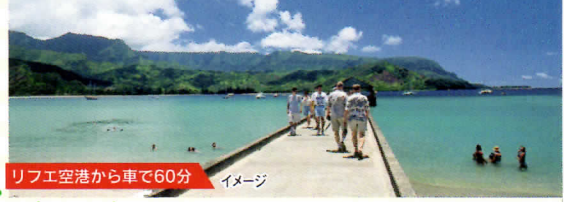
リフエ空港から車で60分 イメージ